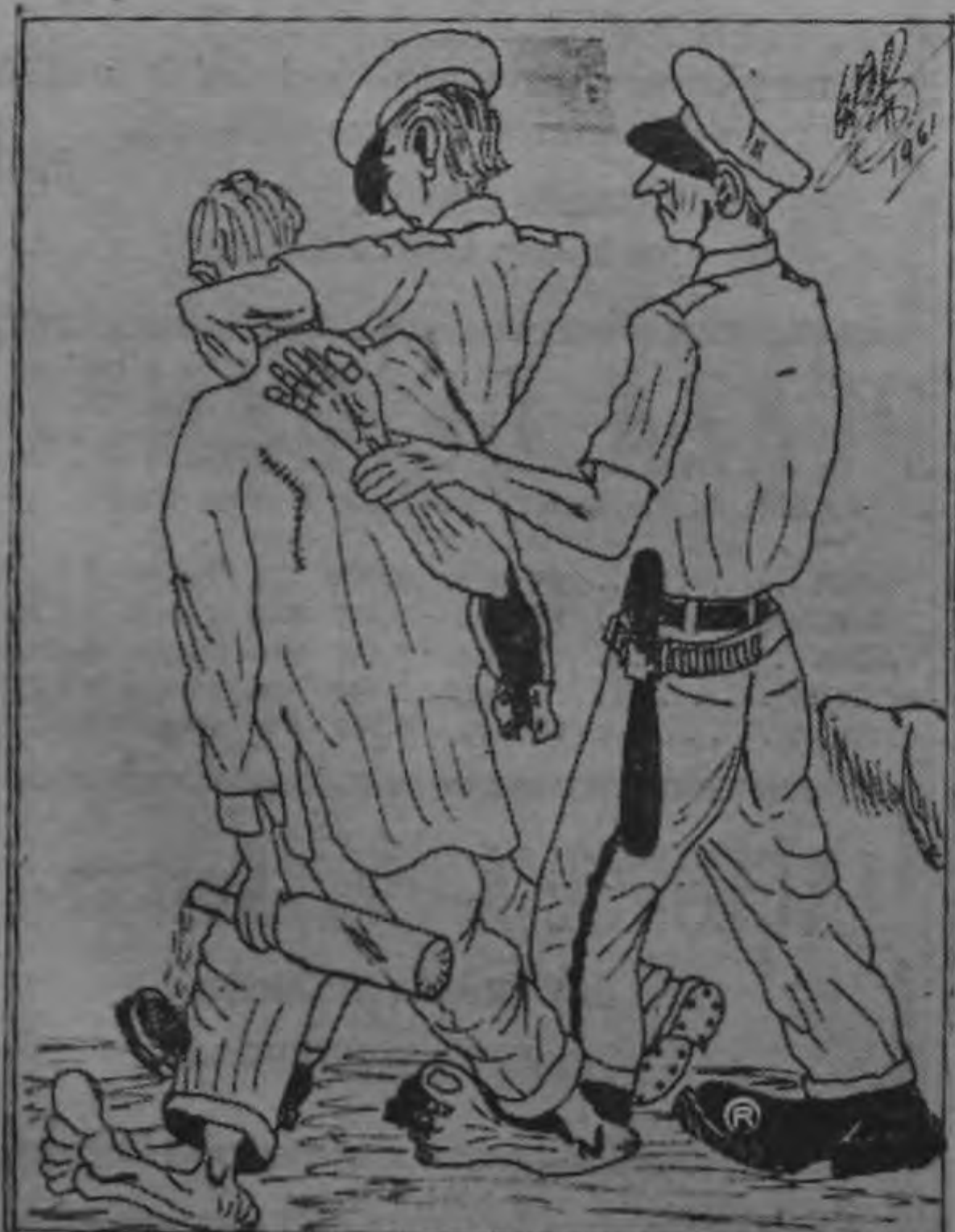
EL POLICIA.—No se ponga feo, chavalo; más tarde respira... si llega vivo!