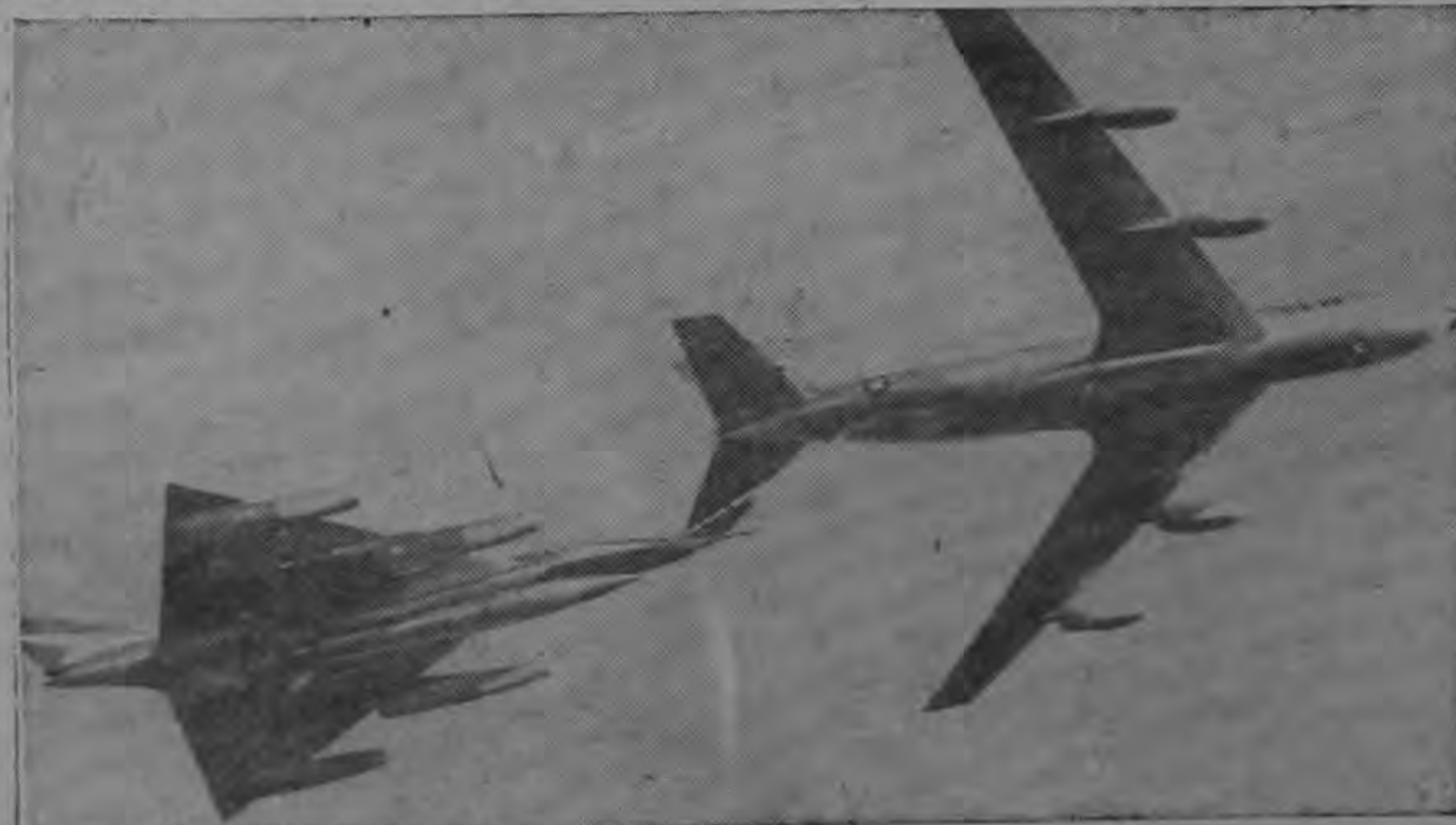
LO ABASTECEN EN EL AIRE.—Un bombardero B128, cuya velocidad es dos veces mayor que la del sonido, manobra en su vuelo para ser

Estos seminarios, que se iniciarán a principios de marzo, formarán parte de una reunión más amplia en la cual se discutirán temas diversos, tales como "El Capital Extranjero en la América Latina", "Dictadura y Comunismo", etc.